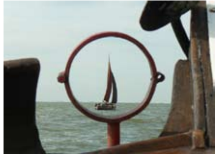
Botter in het vizier.

Tijdens het zeilen kon ik het niet laten om een paar mooie foto's te maken, waaronder deze foto van Trui genomen vanaf de VN4 op de terugweg naar Enkhuizen. Omdat je met een groep een hele dag op een boot bent, leer je elkaar gemakkelijk kennen. Dit was dus ook een erg relaxe manier van kennis maken met de vereniging! Ondanks dat wij wel met oppervlakte water in contact kwamen en ook alcohol mochten nuttigen, was dit velen malen leuker dan een ontgroening bij Virgiel of DSC!