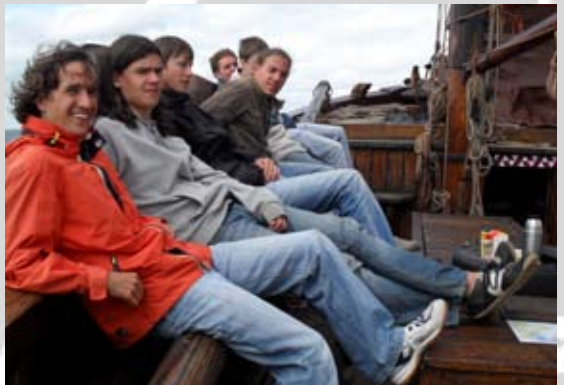
Chillen op de kluiver paal.

Na het zeilen zijn we teruggegaan naar Delft om met de rest van de vereniging kennis te maken. Daar zijn de schjaars een dag gebleven en toen was het na 6 dagen echt tijd om naar huis te gaan. Tijdens de treinreis naar huis was ik heel tevreden, ik had nieuwe mensen ontmoet, kennis met de vereniging gemaakt een hele mooie zeilreis achter de rug. Mijn vakantie zat erop.