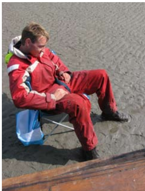
Overpeinzing op het wad.

Veel is er gebeurd sinds de vorige uitgave van de bulletalie. De botter is weer in de vaart gegaan en vanuit onze vertrouwde thuishaven het Zuiderzeemuseum in Enkhuizen zijn er in het voorjaar verschillende mooie weekenden gevaren. Zelf ben ik tijdens het weekend waarin de botter haar jaarlijkse weg van haar 'klus' haven Rotterdam naar haar 'zeil' haven Enkhuizen maakt schipper geworden. Dit betekende direct dat ik een aantal weekenden zelf met de botter op pad mocht deze kans heb ik natuurlijk met beide handen aangegrepen. Op mijn eerste weekend en weekendje naar Stavoren en via de nieuw aangelegde haven bij het 'voegeiland' terug.