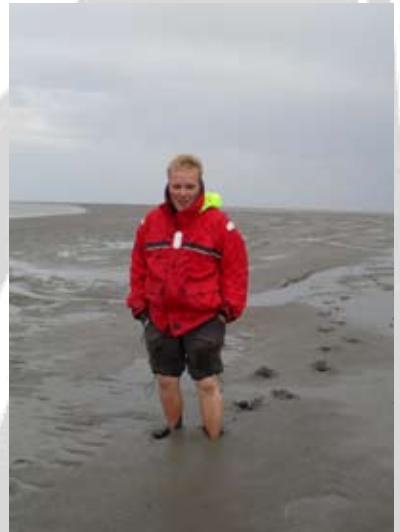
Charmant, die modderige benen.