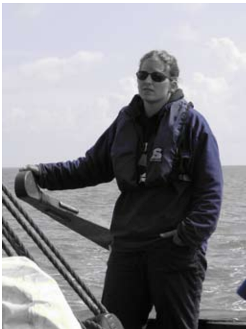
heel nonchalant, maar al bijna als een echte schipper