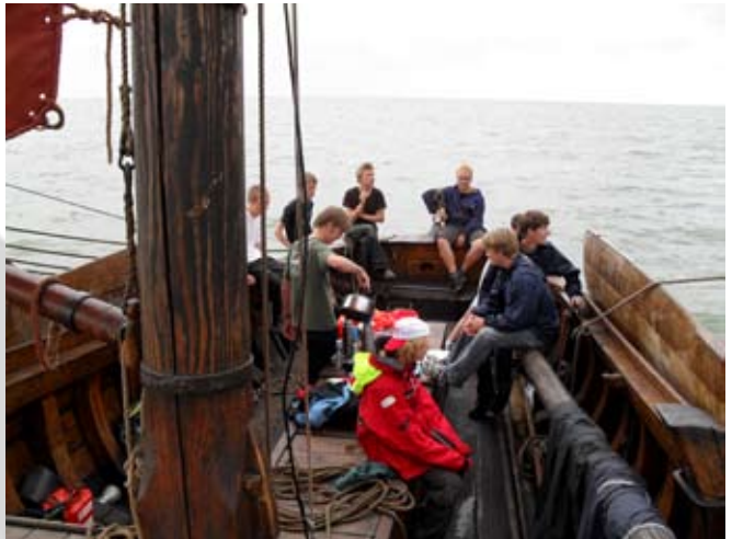
Smachtend naar de koffie word er ook nog genoten van het uitzicht.

Voor m'n gevoel gingen de boten niet heel erg hard, maar we hebben dan ook volgens mij niet heel veel wind gehad tijdens de KMT. Het was wel heel gezellig op de boot, maar ik had niet het gevoel dat het heel hard werken was. Dit komt waarschijnlijk omdat bidders bedoeld zijn om met twee mensen te besturen, en wij er met 8-12 man op zaten. Dat betekent weinig werk in totaal, als je netjes afwisselt.