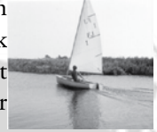
Pak je vergrootglas maar.

Als nieuwe commissaris mocht ik niet alleen stukjes van andere mensen in de bulletatie verwerken, maar werd mij ook meteen gevraagd of ik iets wilde vertellen over mijn bootje. Dit wil ik jullie natuurlijk niet onthouden dus ik zal proberen een korte uitleg te geven over wat voor een bootje ik heb.