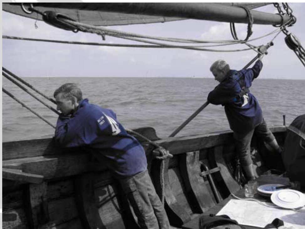
Schipper op zijn best.