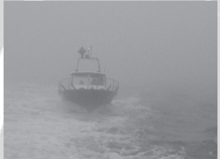
Meer dan we die hele dag haddengezien.

De volgende dag hebben we de hele dag in de mist gevaren. We zagen niets maar moesten wel de hele dag opletten op tonnen en andere schepen. Bij Enkhuizen heeft de KNRM-boot ons de haven ingeloodst. We hebben nog een rondje gelopen door het museum. Daarna gegeten, opgeruimd en toen zijn we naar huis gegaan.