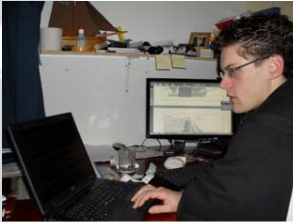
De nieuwe Comissaris Bulletalie druk aan het werk.