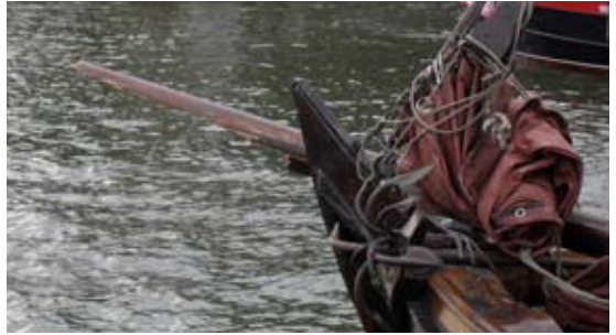
Geknakt in zijn trots.

Vingers gleden langs de lijken de ogen sloeg men aan Een ogenblik later Was het doek klaar om te gaan.