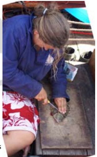
De moord op Ben Berend Botje.