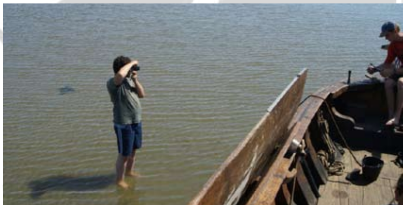
Droovallen levert mooie plaatjes op!