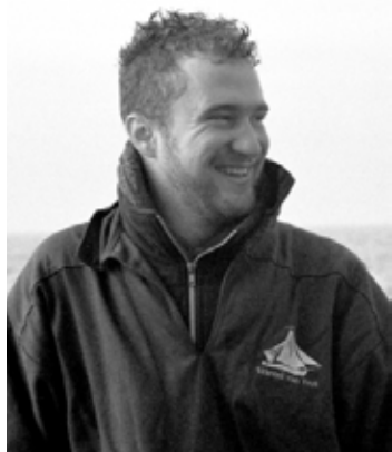
Nautisch kijken is ook heel belangrijk!

Al met al was ik dus al een tijdje bezig. In de tussentijd ben ik 3 winters onderhoudscommissaris geweest, en toen dat afliep en ben ik na een tijdje in de VVT gegaan, waar ik nog steeds voorzitter ben. Als ik kijk naar de hoeveelheid tijd dat ik het al naar mijn zin heb met de boot, ben ik bij dat ik toen met m'n gevoel gekozen heb.