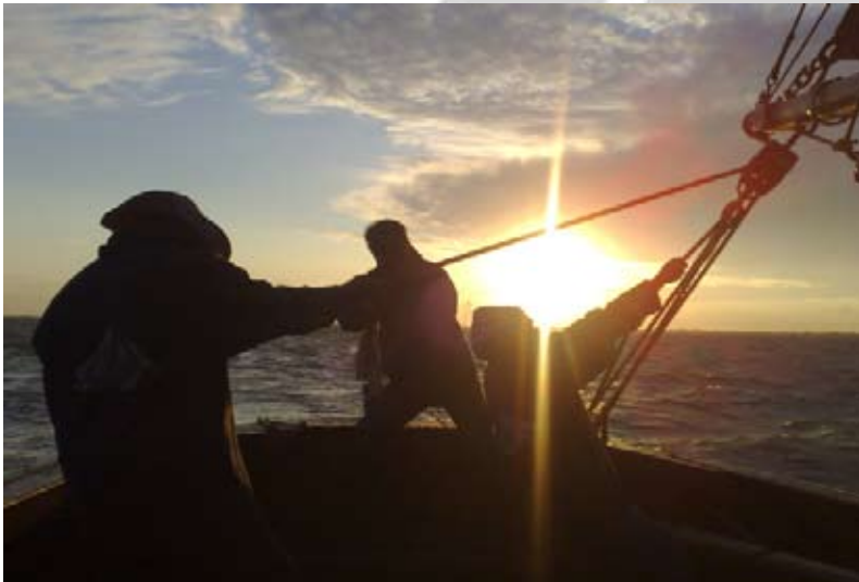
Voor de wind zeilen op het wad betekend wel vaak giġen.