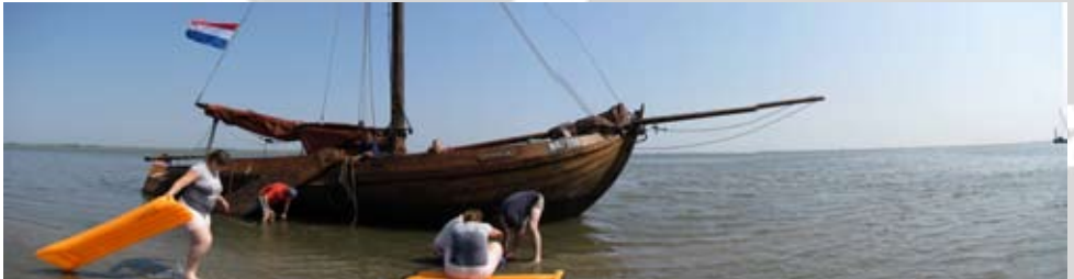
Het zware leven van droogvallen.

Een kort bezoek aan de Spelunke vormde onze enige kennismaking met het