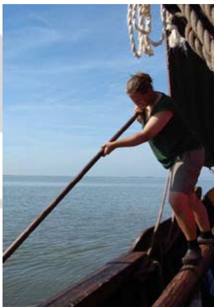
De plaat overboment.